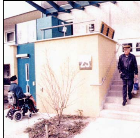
Eine Bank mit Aussicht im Eingangsbereich – zusammen mit der Aufzugsnachrüstung nutzerfreundlich für alle Altersgruppen (2).