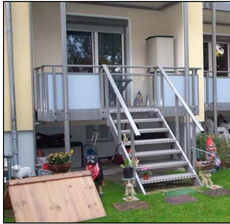
Eine Treppe vom Balkon zum Erdgeschossgarten erspart mühsame Wege ums Haus herum.

Nachfolgend seien einige wenige Beispiele gezeigt: