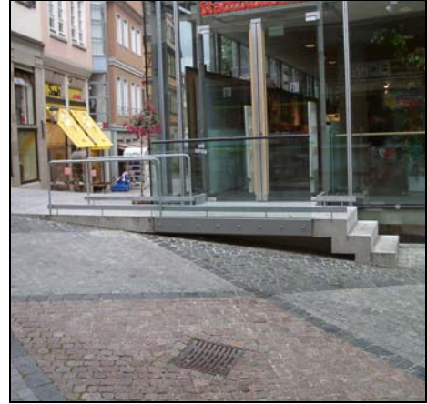
Im leicht hängigen Gelände lässt diese Rampen-Treppen-Kombination dem Nutzer die Wahl.